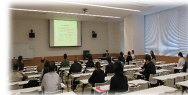
講演：株式会社NTT西日本ルセント 経営企画部 林 祐行様